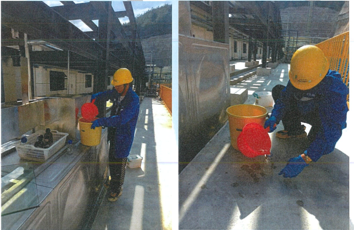
7-2 部分现场采样照片